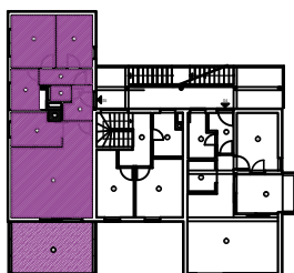
TLOCRT I. KATA